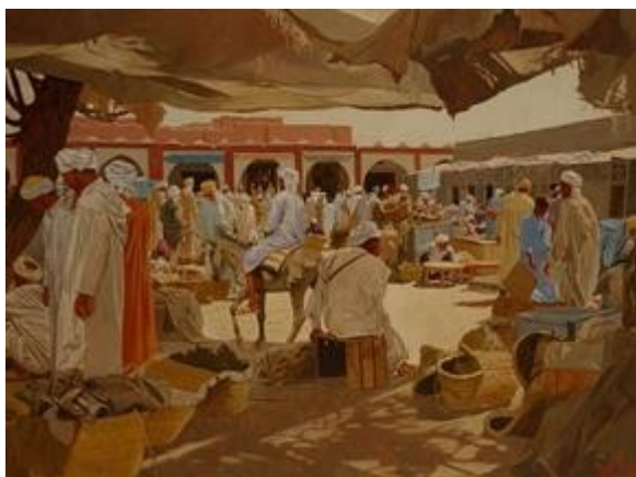
Le Souk de Rissani

Peintre orientaliste, créateurs d'affiches restées dans les mémoires (Guerlain, Citroën, Croisières Paquet, Hermès), illustrateur des textes de chansons écrites par son grand ami Claude Nougaro, il a aussi immortalisé les plus grands événements sportifs (les 24 Heures du Mans, Roland Garros, le PSG... et tant d'autres...)