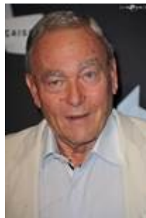
Yves Boisset (Réalisateur),