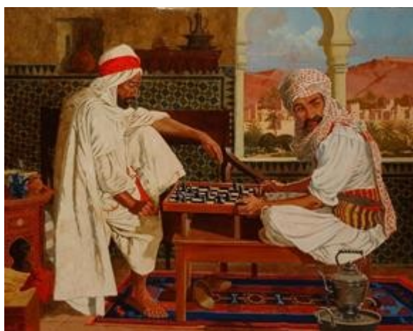
Les Joueurs de Damas

Peintre orientaliste, créateurs d'affiches restées dans les mémoires (Guerlain, Citroën, Croisières Paquet, Hermès), illustrateur des textes de chansons écrites par son grand ami Claude Nougaro, il a aussi immortalisé les plus grands événements sportifs (les 24 Heures du Mans, Roland Garros, le PSG... et tant d'autres...)