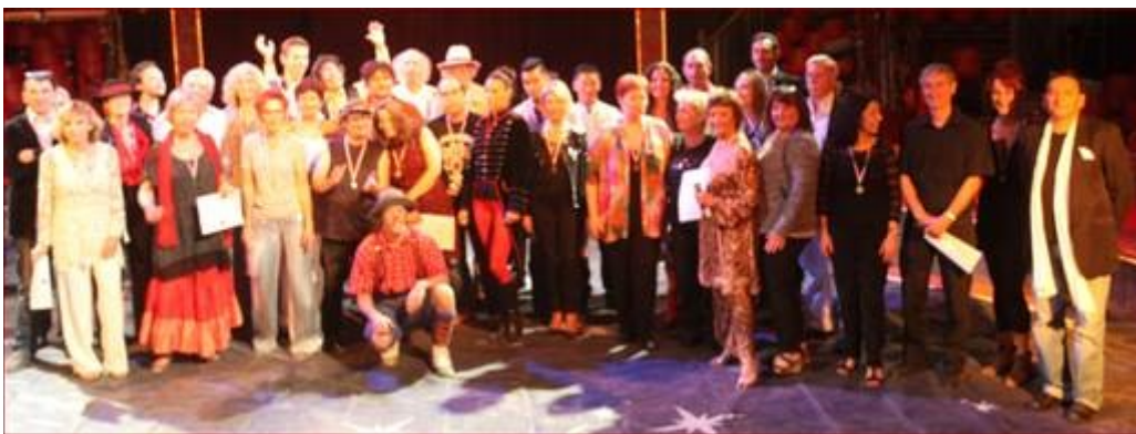
Le Cirque Diana Moreno Bormann, nos hôtes, les organisateurs et les compétiteurs