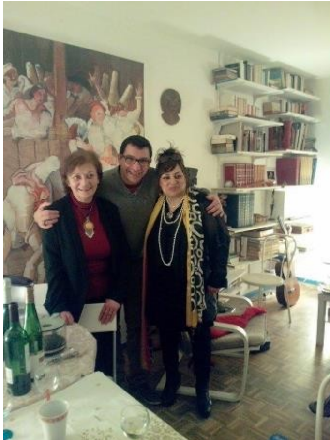
De gauche à droite :