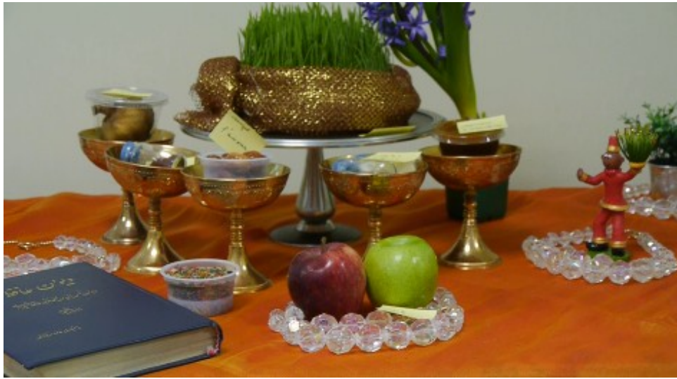
La table du Now Rouz (spécialités présentées lors de cette fête du printemps).