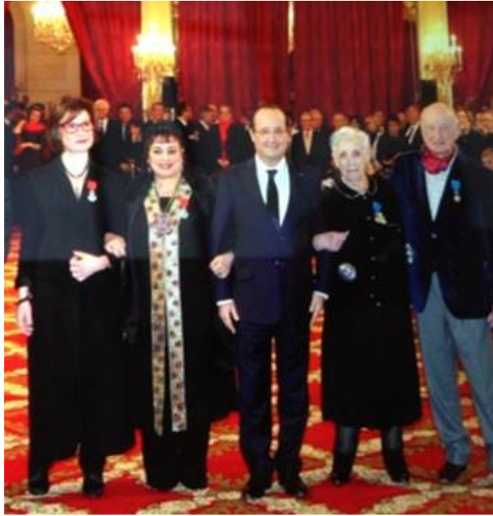
Djura, à la droite du Président Hollande, lors de sa remise de Légion d'Honneur

Bien que née à Ifigha, village kabyle perdu dans les montagnes, Djura a toujours vécu en France. Elle a connu la dure condition du petit peuple d'ouvriers immigrés, entassés dans des camps de transit, dans des cités-dortoirs, la confrontation permanente entre les coutumes ancestrales de sa famille et le mode de vie des jeunes de son âge. Dououreusement prise en tenailles entre la pression d'une société musulmane aux archaïsmes tenaces et son aspiration à pouvoir réaliser ses propres rêves, prendre en mains sa propre destinée.